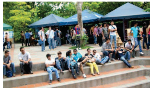
1. Alumnos disfrutando de la feria de proyectos y la música en vivo