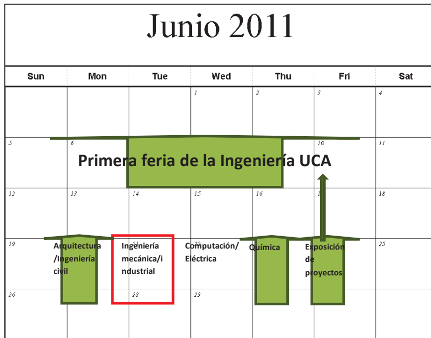
Figura 2 Programación de actividades mes de junio