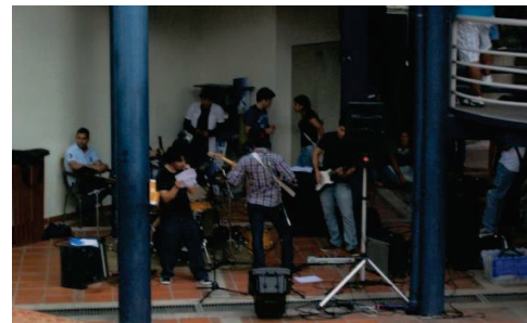
3. Grupo Nepshine tocando en vivo