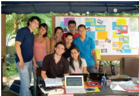
2. Alumnos de Ingeniería Química durante la feria