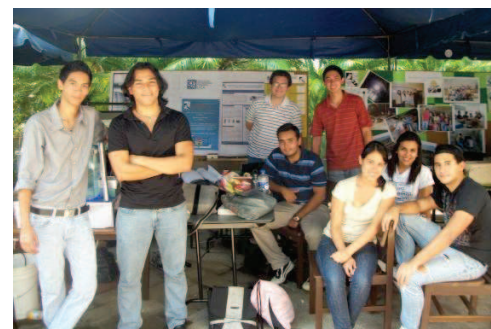
4. Alumnos de Ingeniería Mecánica e Ingeniería Industrial