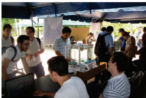
5. Feria de Proyectos