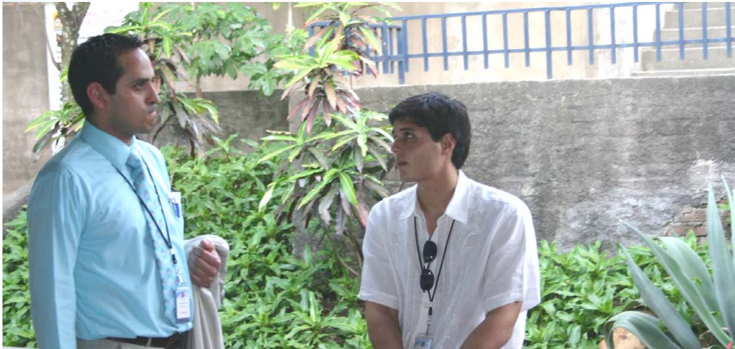
El presidente del MOEA dialogando con el representante de Guatemala.

Es trascendental porque nuestros Estados tienen que evolucionar y garantizar mejores condiciones de vida. Es importante también que los jóvenes comencemos a dar soluciones para contribuir a los problemas que aquejan al continente. Como jóvenes, nosotros entendemos lo grave y perjudicial de la situación y tenemos la posibilidad de dar nuestra opinión sobre cuáles creemos que pueden ser las soluciones viables para solucionar estas problemáticas.