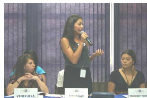
Intervención de la representante de Uruguay en la quinta comisión.

Las aprobaciones continuaron durante el resto del día. Se aceptaron las resoluciones de Argentina, Estados Unidos, Jamaica, Guatemala, Venezuela, Panamá, Barbados y Trinidad y Tobago, siendo 11 en total. La sesión de ayer no tuvo los obstáculos que estuvieron presentes el pasado miércoles. Por ello, la Delegación de Colombia expresó: “El conocimiento de debate se ha asimilado mejor; además, la REC ha realizado una excelente revisión de fondo de cada resolución, factor