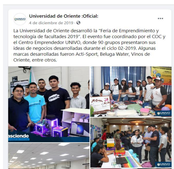
Publicaciones en Fanpage UNIVOSM